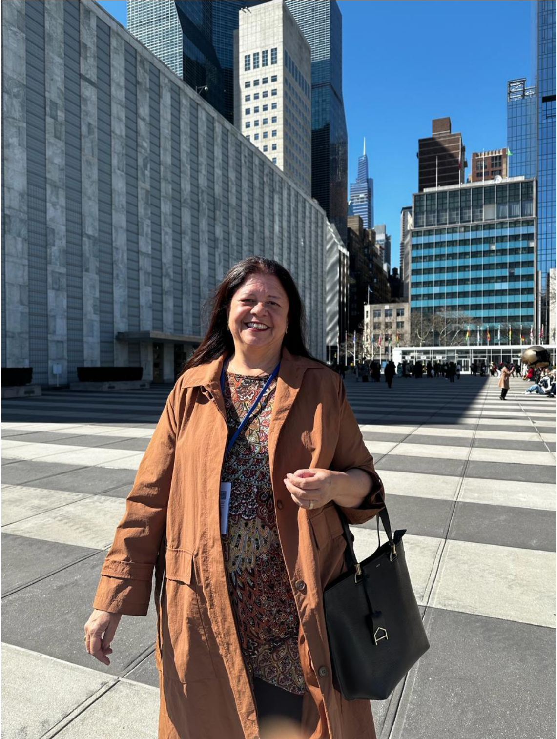
11 de março, Primeiro Dia , chegando na Sede da ONU