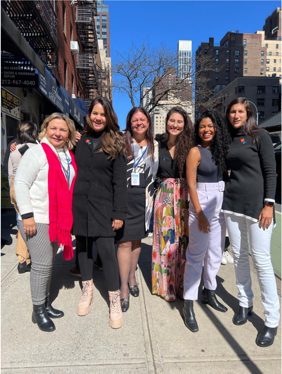
Comitiva do Rio de Janeiro