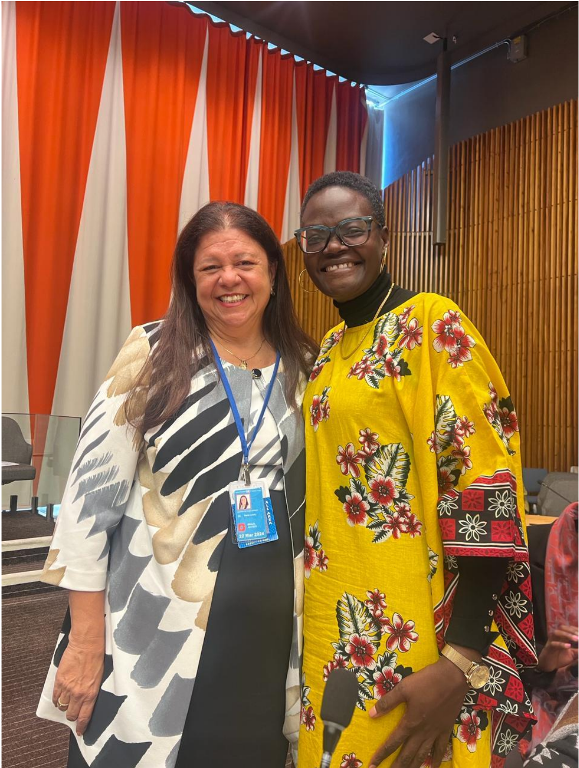
Presidente da UIP, Dra Tulia Ackson