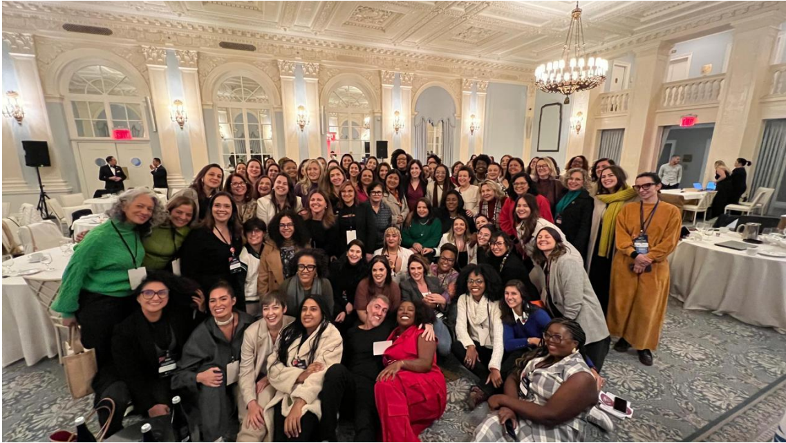
Reunião do Pacto Global da ONU – “Unidas somos mais fortes”