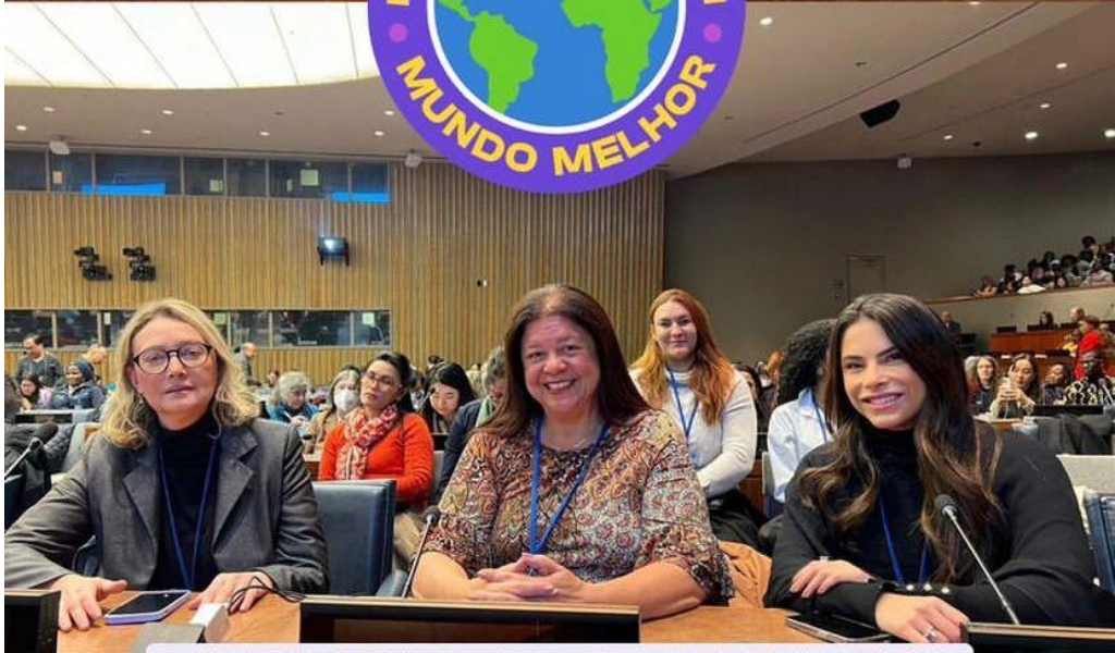
📍 UNITED NATIONS ORGANISATION (ONU) - NEW YORK CITY