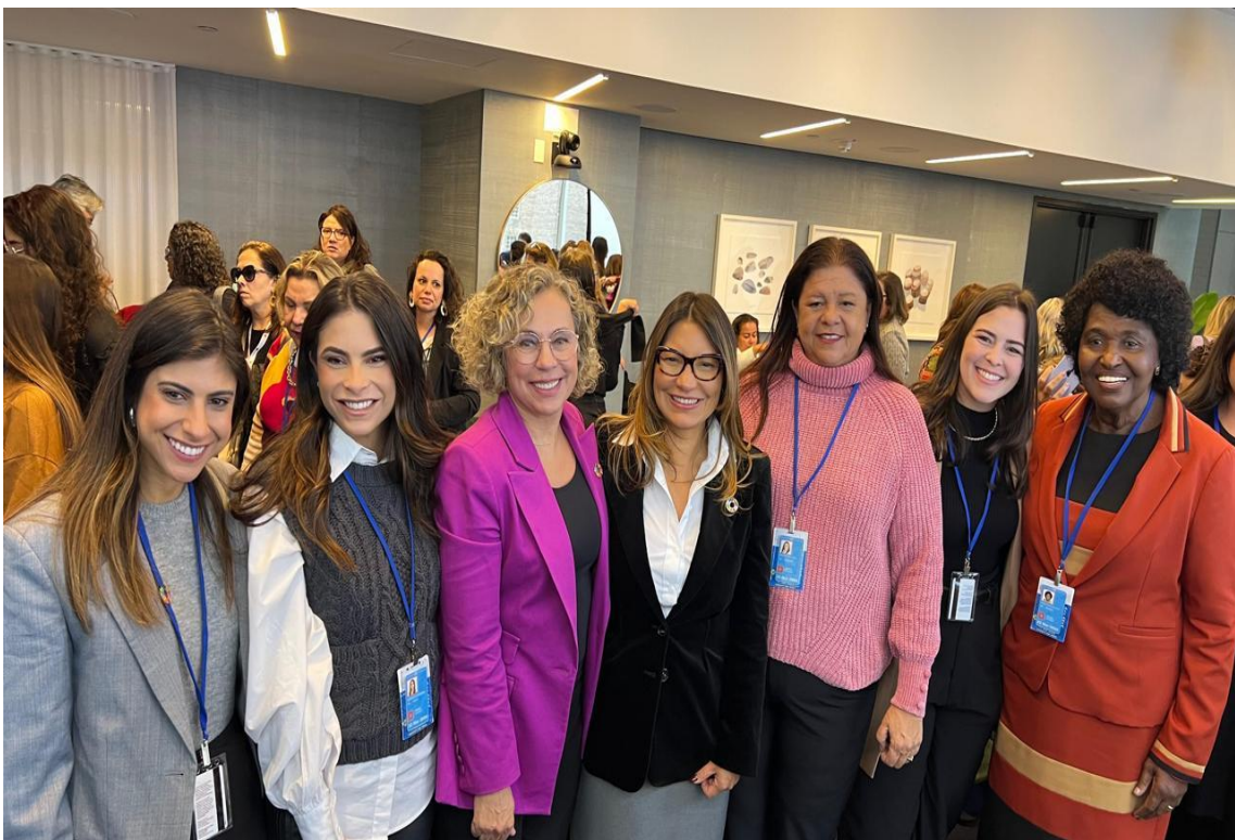
Espaço da Mulher Brasileira, parlamentares acompanhadas pela Primeira-Dama Janja Lula da Silva