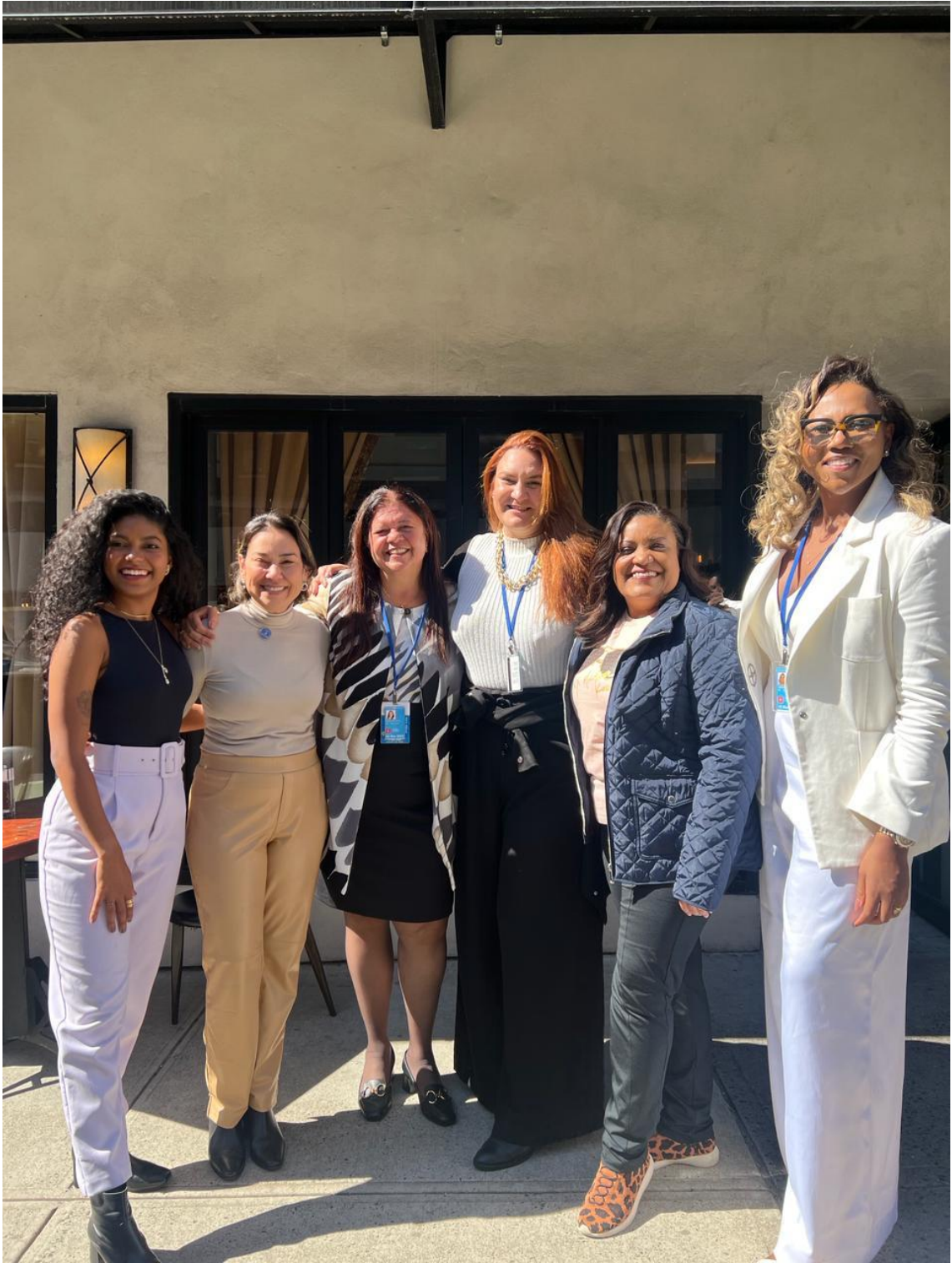
Comitiva do Rio de Janeiro