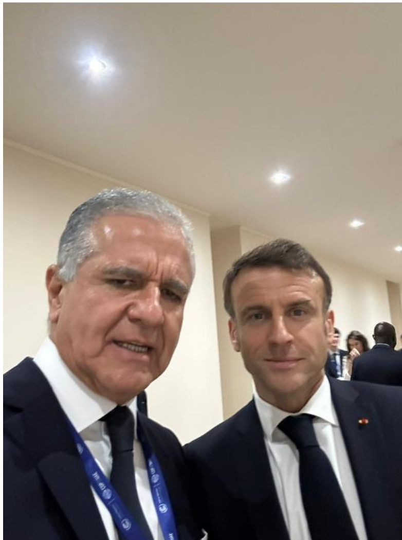
Com o presidente da França, Emmanuel Jean-Michel Frédéric Macron Visita a usina WtE