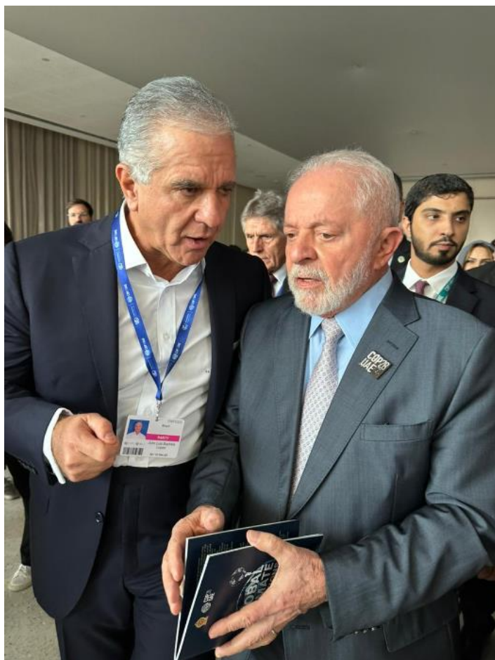
Com Presidente do Brasil, Luiz Inácio Lula da Silva