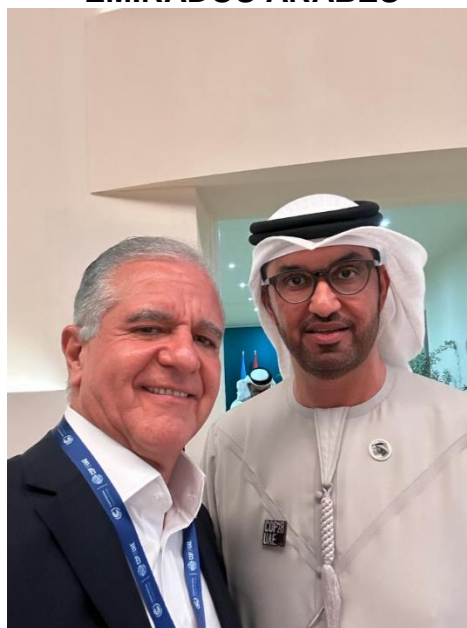
Com o presidente da Cop Sultan AHMED AI - JABER - Ministro da Indústria e Tecnologia Avançada dos Emirados Árabes Unidos