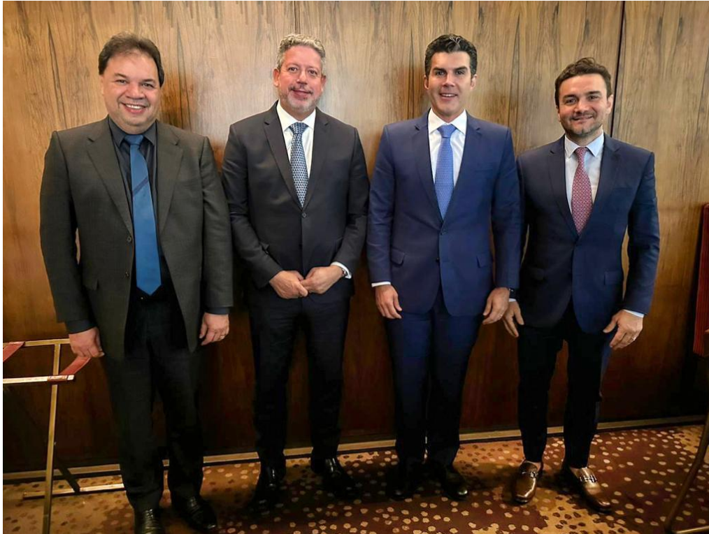
Conferência CITI ISSO DATAGRO sobre Açúcar e Etanol – 04