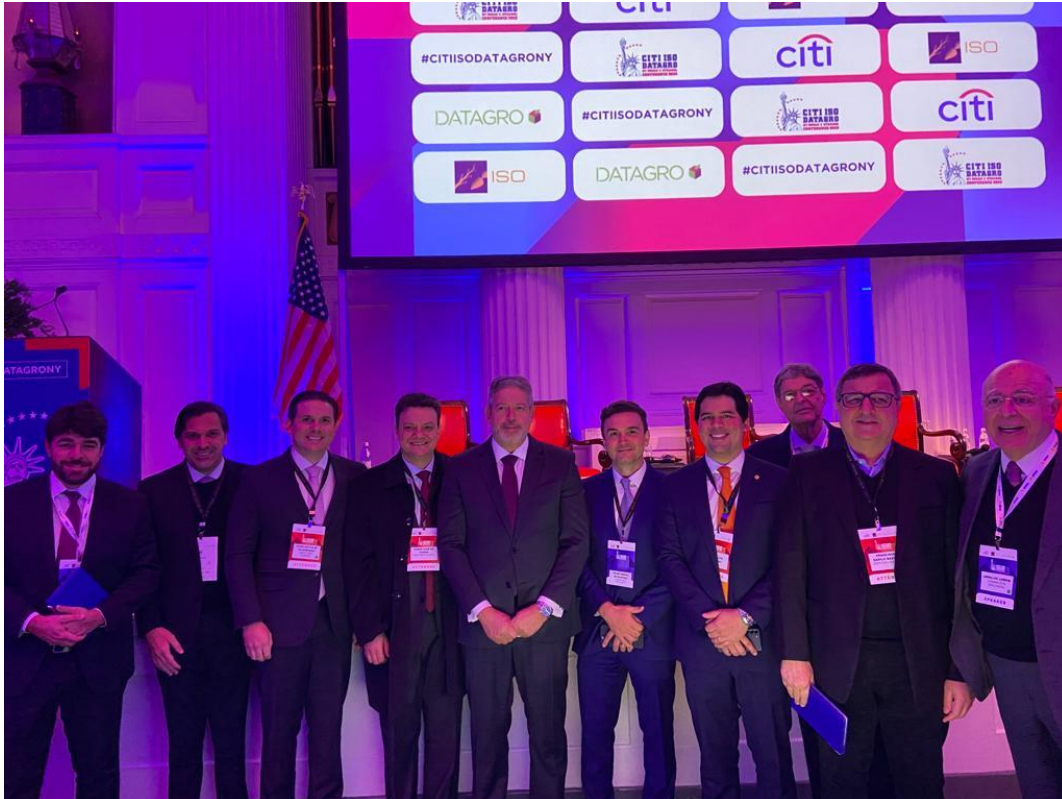
Conferência CITI ISSO DATAGRO sobre Açúcar e Etanol – 01