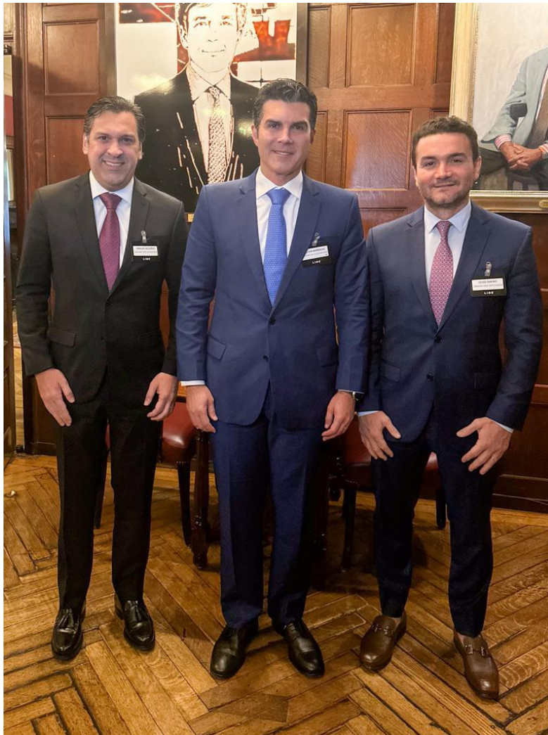
Conferência CITI ISSO DATAGRO sobre Açúcar e Etanol – 03