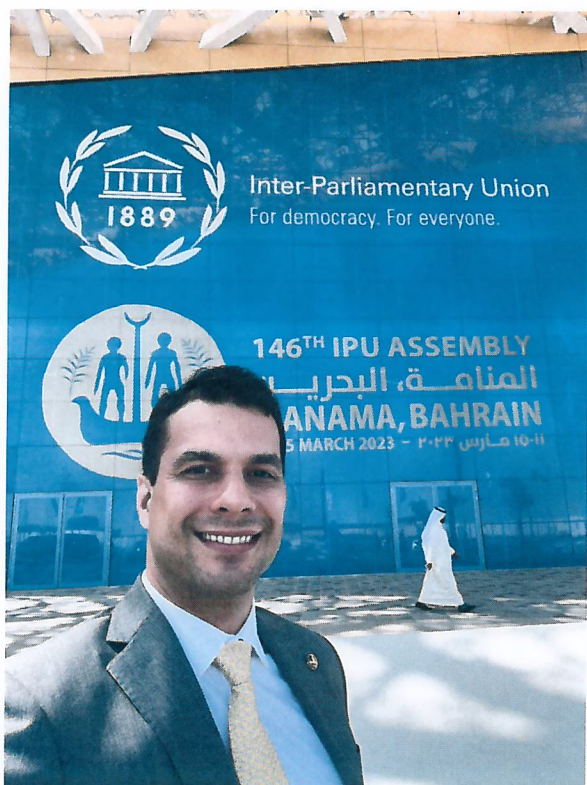
Figura 5 - Senador Irajá