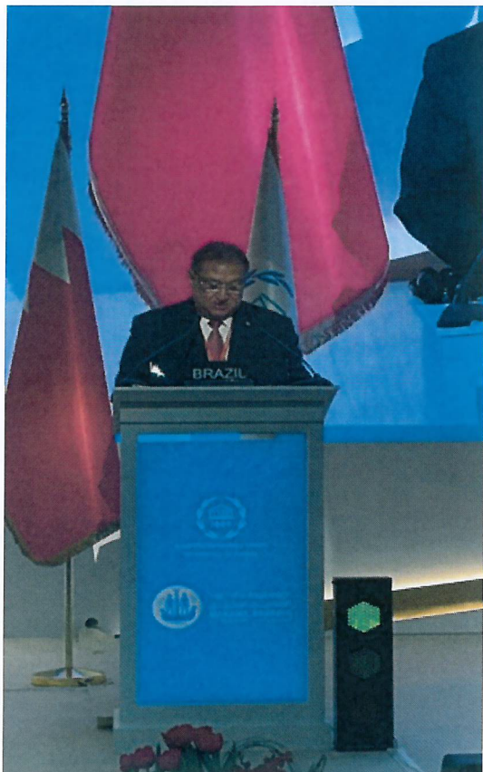
Figura 3 - Deputado Átila Lins