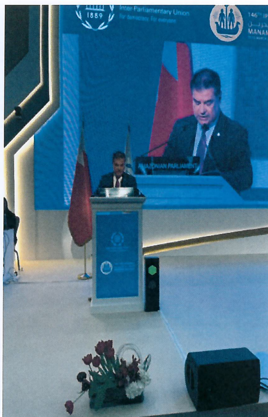
Figura 3 - Senador Nelsinho Trad