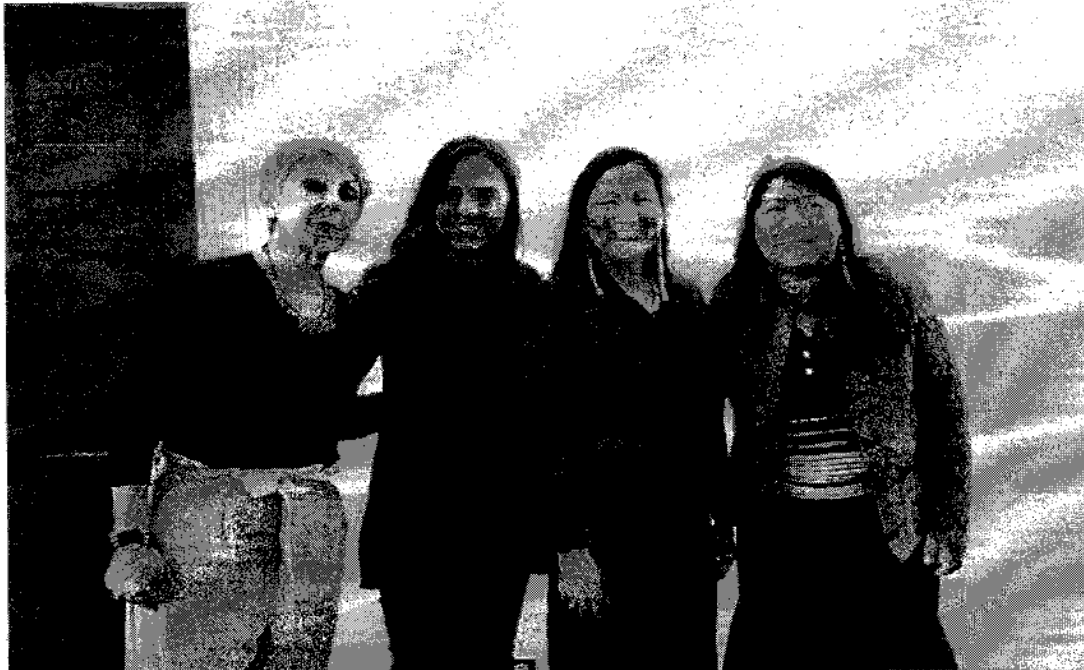
Deputada Deb Haaland

Praça dos Três Poderes - Congresso Nacional Câmara dos Deputados, Anexo IV, Gabinete 203 Brasília - DF - CEP 70.160-900 Dep.joeniawapichana@camara.leg.br Fone: 3215 5203