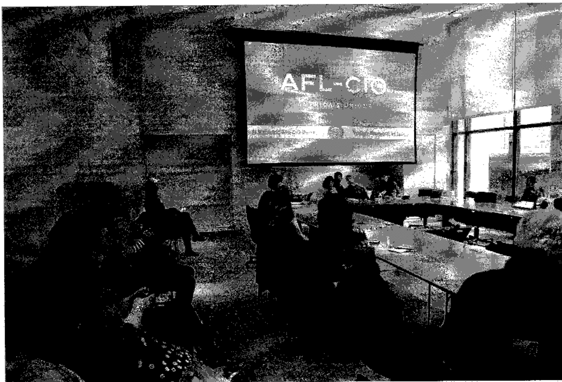
Fórum Público em AFL-CIO

Praça dos Três Poderes - Congresso Nacional Câmara dos Deputados, Anexo IV, Gabinete 203 Brasília - DF - CEP 70.160-900 Dep.joeniawapichana@camara.leg.br Fone: 3215 5203