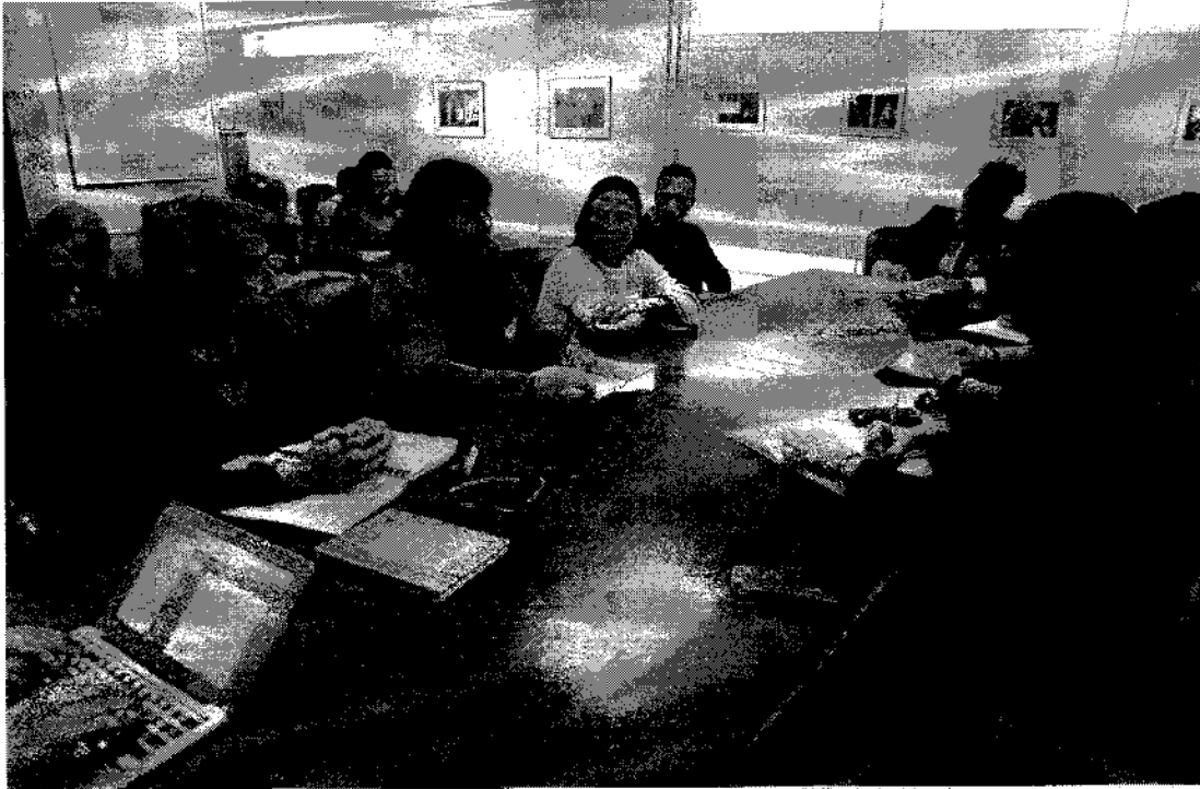
Visita a Comissão Interamericana de Direitos Humanos da OEA