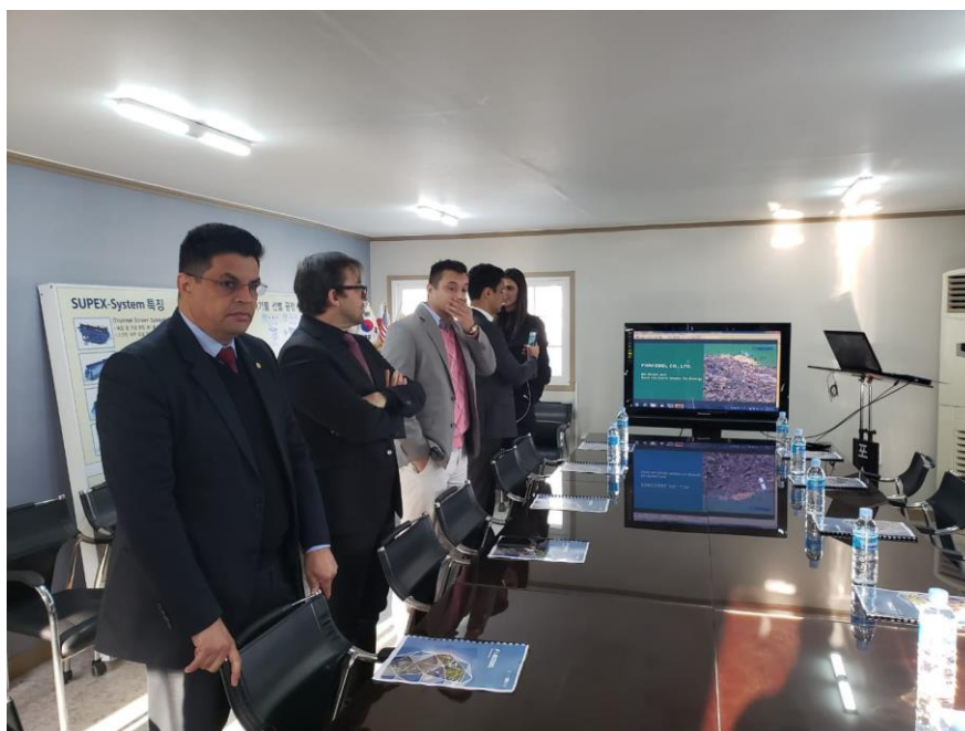
Visita à FORCEBEL

Nesta data ainda houve visita à empresa de reciclagem FORCEBEL CO.