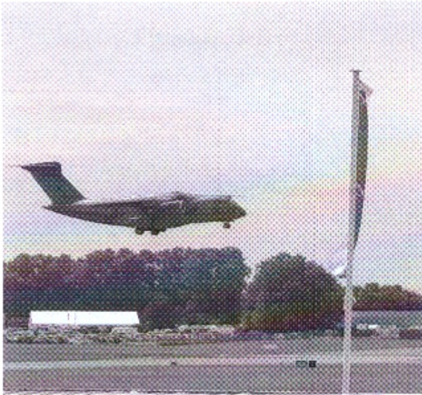
KC – 3