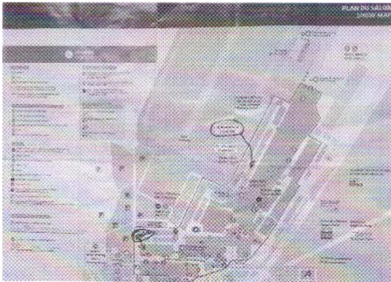
Croquis da Feira de Le Bourget