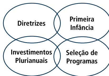
FIGURA 2. PRIORIDADES NO PLPPA 2020-2023

Por tudo, e a despeito da feição estratégica que se procurou conferir ao PPA 2020-2023, que não arrolou de forma pormenorizada o conjunto de políticas prestacionais do Governo, identificam-se lacunas normativas e metodológicas a serem supridas. Há que se cuidar de cumprir o disposto no art. 3º do PLDO, com a efetiva indicação das metas e prioridades para 2020, caso a lei dele resultante não entre em vigor antes da apreciação do PLPPA no Parlamento. Ademais, a sociedade se beneficiaria de maior clareza sobre a definição das políticas públicas prioritárias para o período do Plano, a ensejar ações objetivas de monitoramento e avaliação pelo Estado.