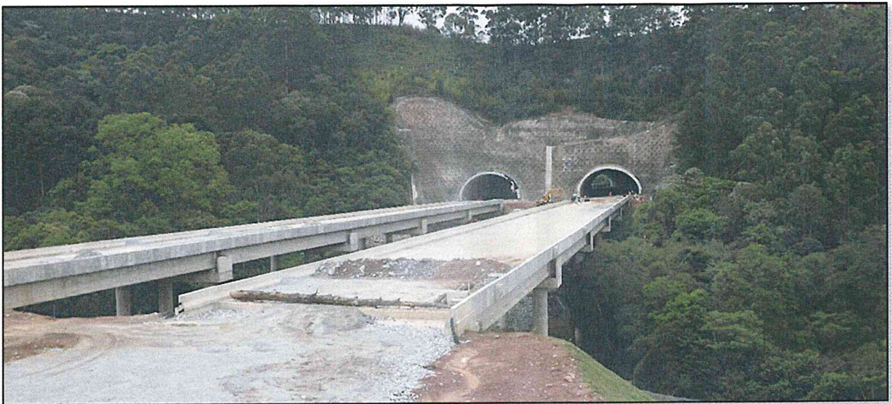
Local: Obra de Arte Especial 423 Descrição: Vista Geral