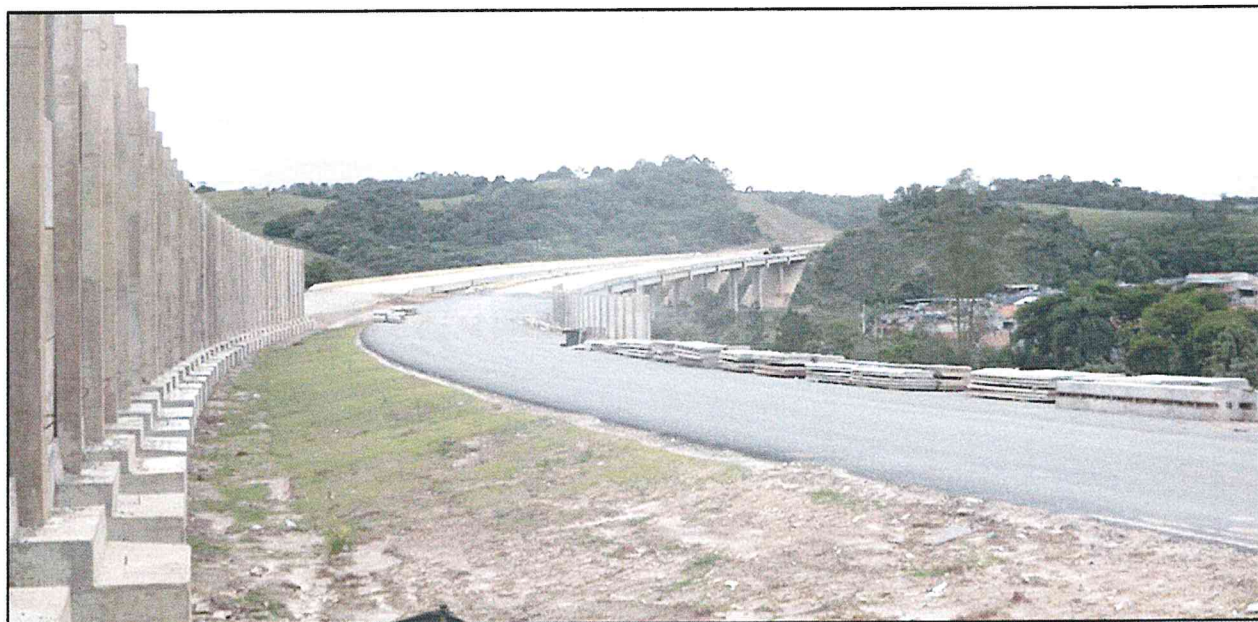
Local: Obra de Arte Especial 603