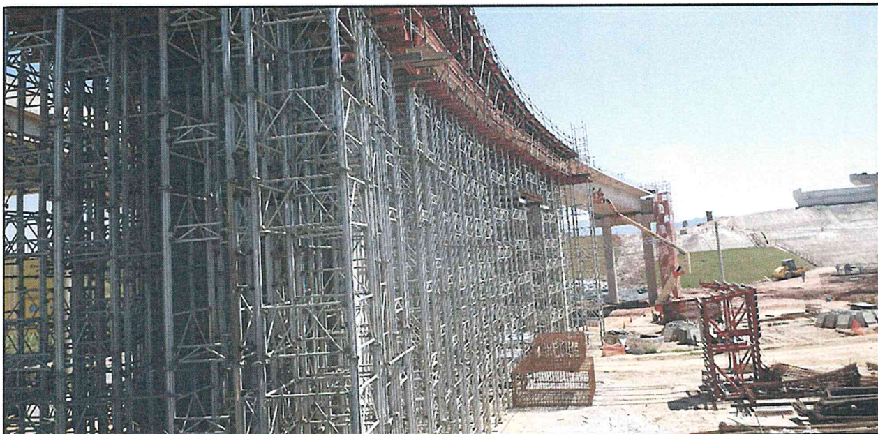
Local: Obra de Arte Especial 615