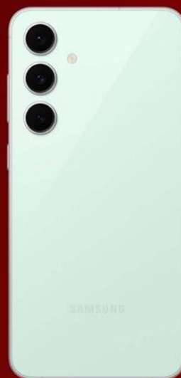
Samsung Galaxy S24 FE 256GB