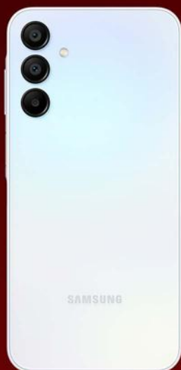
Samsung Galaxy A15 128GB

Registre o melhor do verão com seu novo Samsung Galaxy! Escolha o seu modelo ideal com ofertas imperdíveis da Claro.