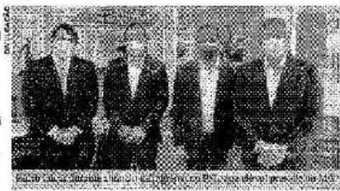
Pedro Lucas Fernandes durante sessão do plenário no Congresso Nacional em Brasília.

JP — Quais as suas perspectivas agora no PSL? PEDRO LUCAS — O PSL é um grande partido, e quando a transição partidária se concretizar o objetivo é contribuir com o nosso trabalho para a expansão do partido em todo estado. O PSL defende posições liberais com um olhar voltado para o desenvolvimento nacional,