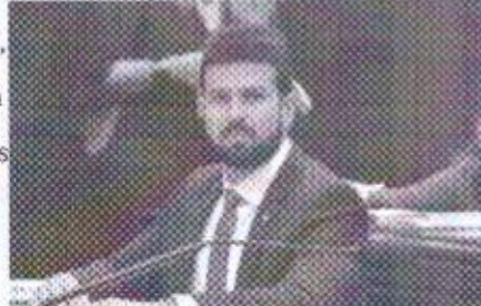
Gil Cutrim é apontado como o deputado federal maranhense mais atuante, na Câmara Federal, na defesa dos municípios

Por seis anos, Cutrim foi prefeito de São José de Ribamar, a terceira maior cidade do Maranhão, e vice-prefeito por dois anos, sendo o primeiro prefeito da história do município a exercer a presidência da Federação dos Municípios do Estado do Maranhão (Famem), em 2012. Dois anos depois, foi reconduzido ao cargo por aclamação. O ranking Observatório Político é uma ferramenta da CNM que tem como objetivo identificar e classificar os parlamentares com o perfil Municipalista, ou seja, os que atuam em consonância com os interesses dos Municípios.