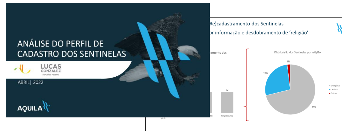
Figura 6: Relatório de análise dos novos dados informados pelos voluntários