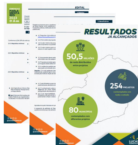
Figura 1: Edital de emendas do Deputado Federal Lucas Gonzalez de 2023