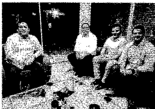
Oposição reunida em Arapiraca