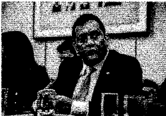
O projeto pretende instituir a gratuidade em eventos públicos artísticos-culturais, esportivos e de lazer

É de autoria do deputado federal alagoano Severino Pessoa (PRB) o Projeto de Lei 3462/2019 que pretende instituir a gratuidade em eventos públicos artísticos-culturais, esportivos e de lazer para crianças e adolescentes com doenças raras ou graves. De acordo com a proposta, os acompanhantes terão direito à meia-entrada.