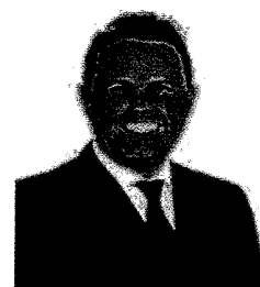
1º Secretário Dep. Covatti Filho PP/RS