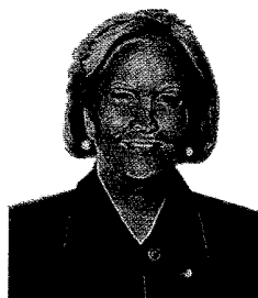
3ª Vice-Presidente Sen. Ana Amélia Lemos PP/RS