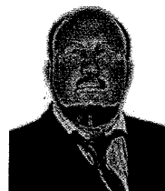
Dep. João Daniel PT/SE