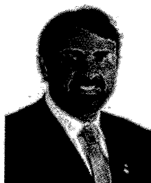
2º Vice-Presidente Dep. Henrique Fontana PT/RS