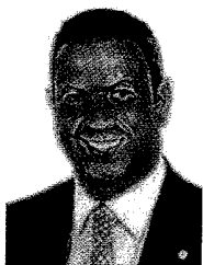
Coord. Estadual - SP Dep. Ricardo Izar PSD/SP