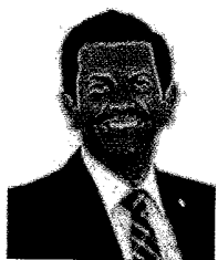
Coord. Estadual - RJ Dep. Otávio Leite PSDB/RJ