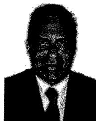
Coord. Estadual - PE Dep. Tadeu Alencar PSB/PE