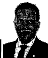
Coord. Estadual - BA Dep. Félix Mendonça Jr PDT/BA