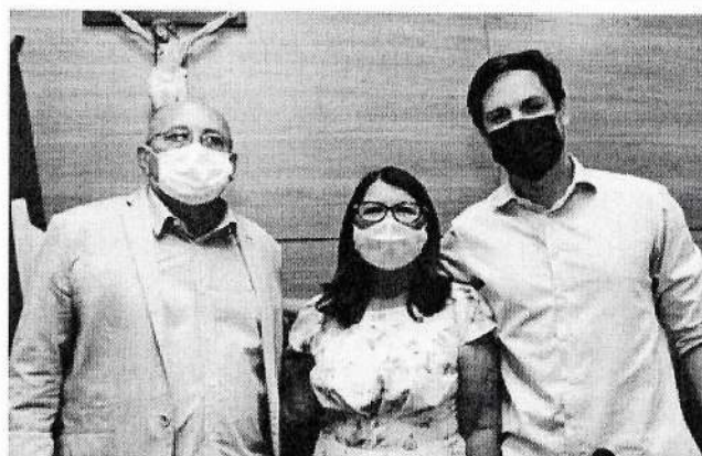
Foto: Rafael Motta (PSB), vereadora Carla Simone (MDB) e o deputado Zé Figueiredo (MDB) / Divulgação