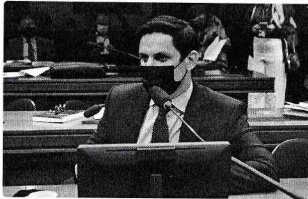
Motta foca emendas para a causa animal