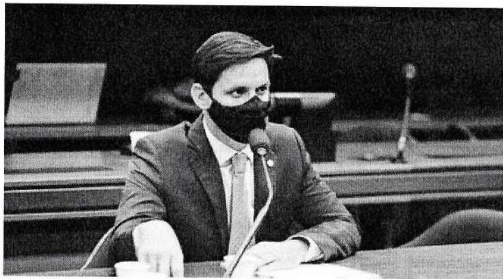
Deputado Federal Rafael Motta.

Caicó, Parelhas e Tibau do Sul (Pipa) serão videomonitoradas com recursos de emendas do mandato do deputado federal Rafael Motta (PSE). A verba para compra de equipamentos de captação e transmissão de imagens – que totaliza R$ 700 mil – teve o pagamento liberado e segue à disposição do Governo do Estado, via Secretaria de Segurança Pública e Defesa Social (Sesed).