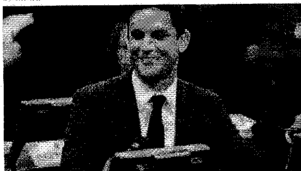
Deputado Rafael Motta

Três emendas apresentadas pelo deputado federal Rafael Motta (PSB) na Lei de Diretrizes Orçamentárias (LDO) 2022 e aprovadas pela Comissão Mista de Orçamento (CMO), nesta quinta-feira 15, beneficiam diretamente o Rio Grande do Norte.