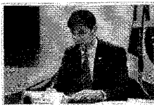
Motta faz várias propostas

Também existem projetos de infraestrutura turística, segurança pública, energia elétrica e oferta de água, salienta sua assessoria.