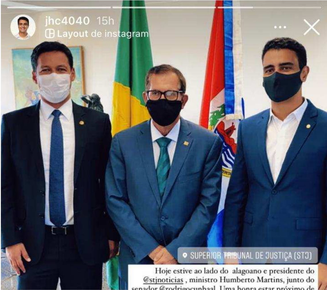
Hoje estive ao lado do alagoano e presidente do @stjnoticias , ministro Humberto Martins, junto do senador @rodrigocunhaal . Uma honra estar próximo de quem, assim como eu, defende a democracia e a transparência.