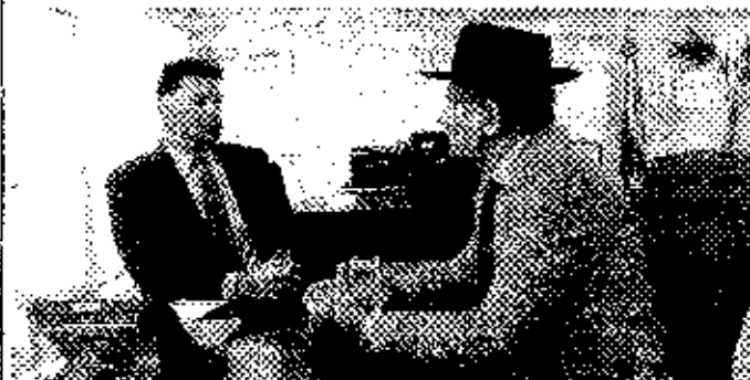
O ministro do Esporte, Leonardo Figueiredo e o Deputado Federal Luiz Carlos Ramos.

O Deputado Federal Luiz Carlos Ramos (PIN-RJ) esteve reunido na tarde de última terça-feira (11) com o ministro do Esporte, Leonardo Figueiredo, em Brasília, para solicitar apoio institucional na liberação de recursos voltados sobre emendas destinadas a municípios fluminenses bem como injeção de incentivos ao esporte para o Estado. Neste momento delicado que o Rio de