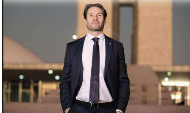
pág 06 boletim informativo

A intenção é, através deste código, sistematizar direitos e deveres do contribuinte perante as fazendas públicas, uniformizando procedimentos e incentivando o bom pagador por meio de redução de multas. De acordo com o texto aprovado pela Câmara dos Deputados, haverá um desconto regressivo sobre as multas e juros de mora para incentivar o contribuinte a quitar voluntariamente o débito.