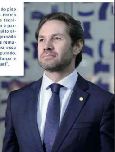
pág 03 boletim informativo