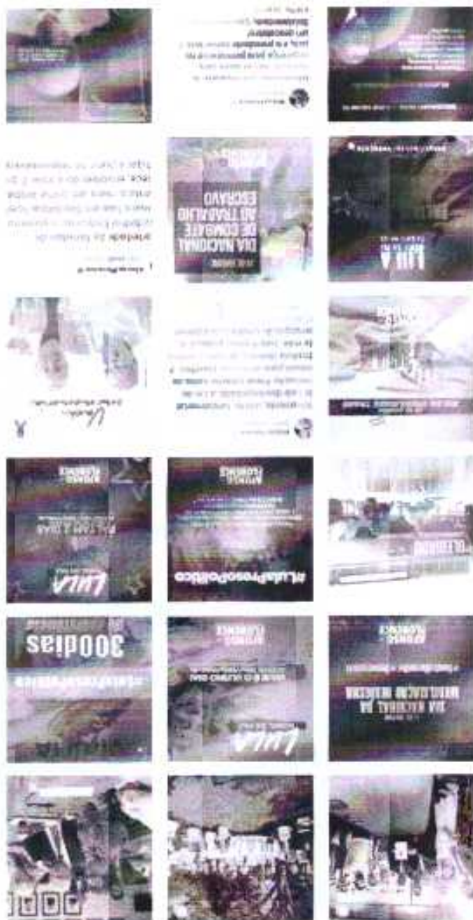
Instagram @AlfonsoFlorence: O Instagram foi alimentado diariamente com divulgação das ações do mandato e agenda de parlamentar no período de 01 a 31 janeiro de 2019.