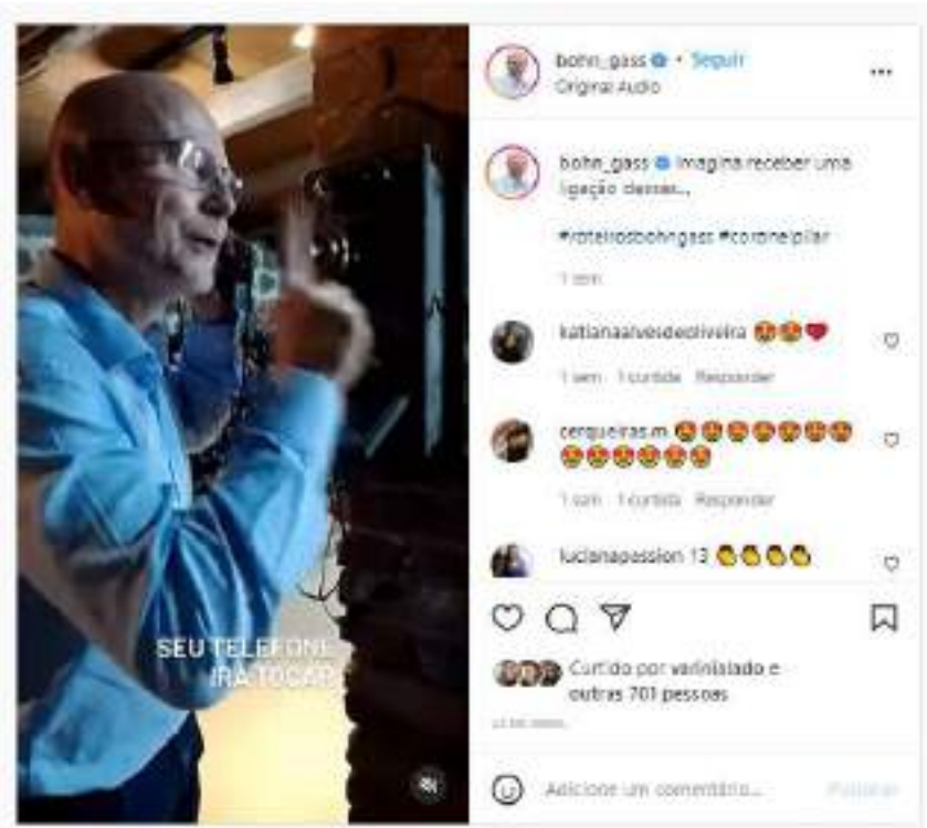
Vídeo produzido e publicado em instagram.com/bohn_gass/reels