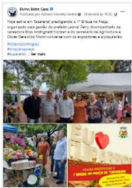
Texto e cobertura fotográfica publicadas na página facebook.com/bohngass13