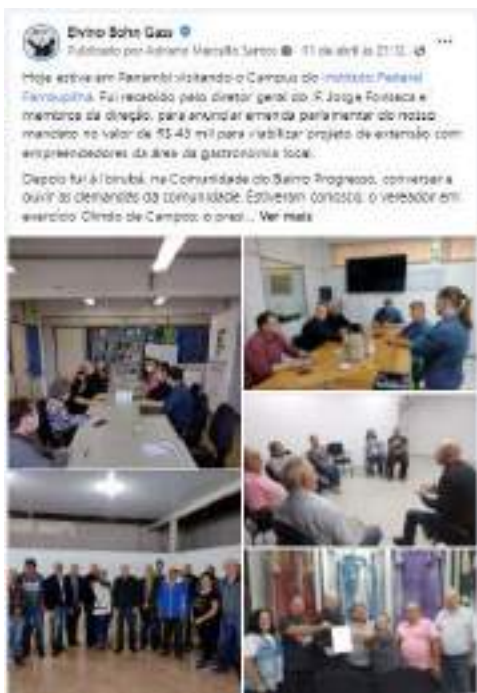
Texto e cobertura fotográfica publicadas na página facebook.com/bohngass13