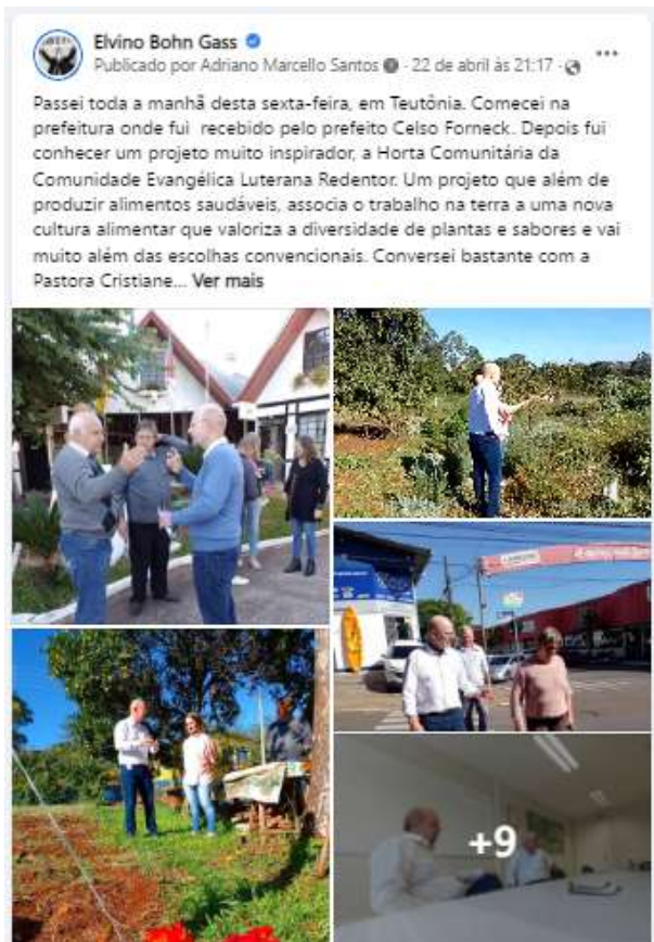
Texto e cobertura fotográfica publicadas na página facebook.com/bohngass13