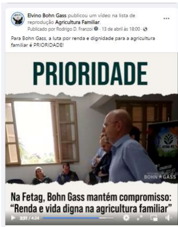
Vídeo produzido e publicado na página facebook.com/bohngass13