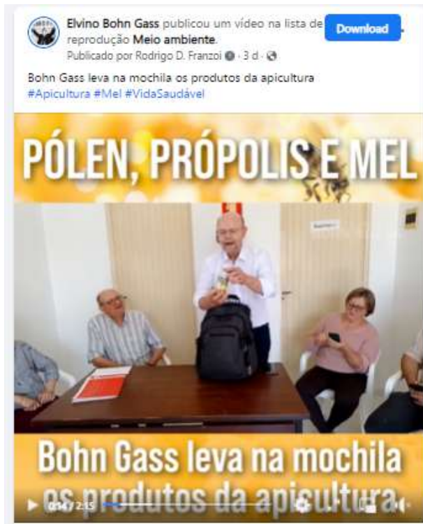
Vídeo produzido e publicado na página facebook.com/bohngass13