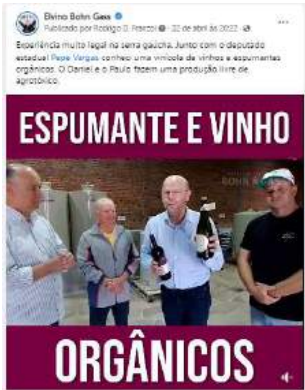
Vídeo produzido e publicado na página facebook.com/bohngass13