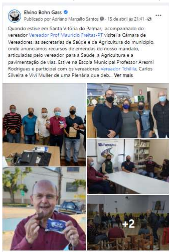
Texto e cobertura fotográfica publicadas na página facebook.com/bohngass13