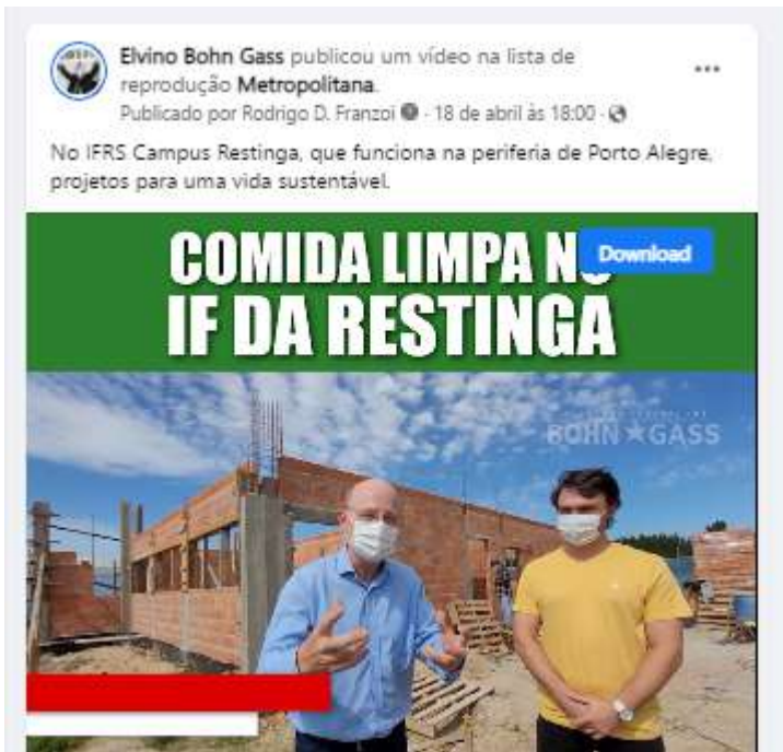
Vídeo produzido e publicado na página facebook.com/bohngass13