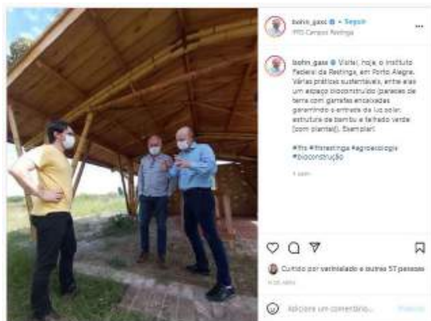
Texto e cobertura fotográfica publicada em instagram.com/bohn_gass/