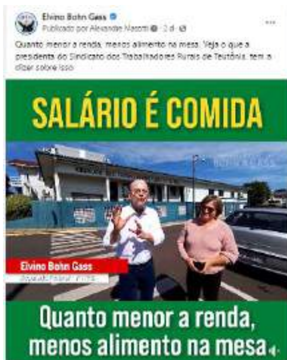
Vídeo produzido e publicado na página facebook.com/bohngass13