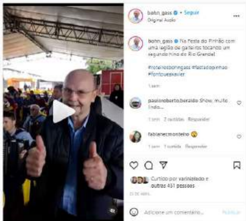
Vídeo produzido e publicado em instagram.com/bohn_gass/reels