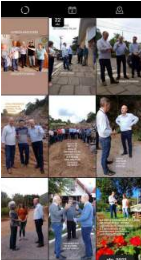
Cobertura fotográfica publicada em instagram.com/bohn_gass/stories