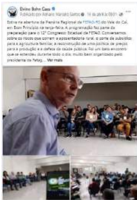
Texto e cobertura fotográfica publicadas na página facebook.com/bohngass13