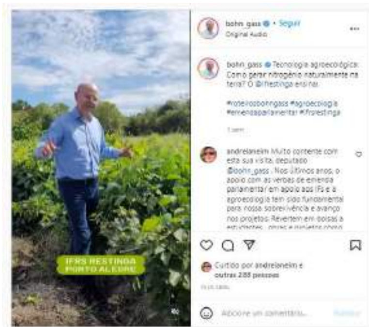
Vídeo produzido e publicado em instagram.com/bohn_gass/reels