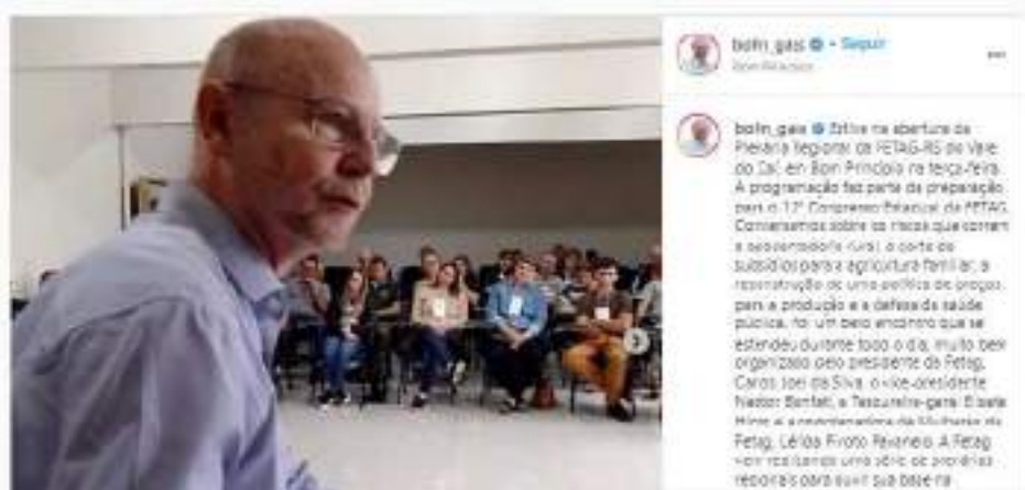
Texto e cobertura fotográfica publicada em instagram.com/bohn_gass/