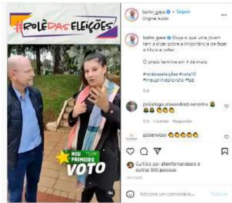
Vídeo produzido e publicado em instagram.com/bohn_gass/reels