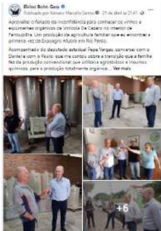
Texto e cobertura fotográfica publicadas na página facebook.com/bohngass13