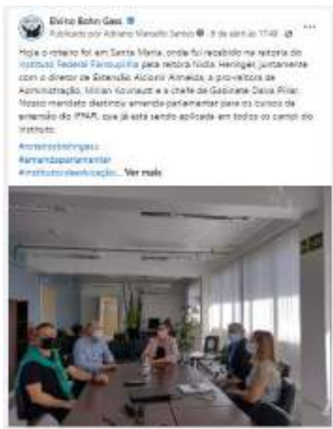
Texto e cobertura fotográfica publicadas na página facebook.com/bohngass13