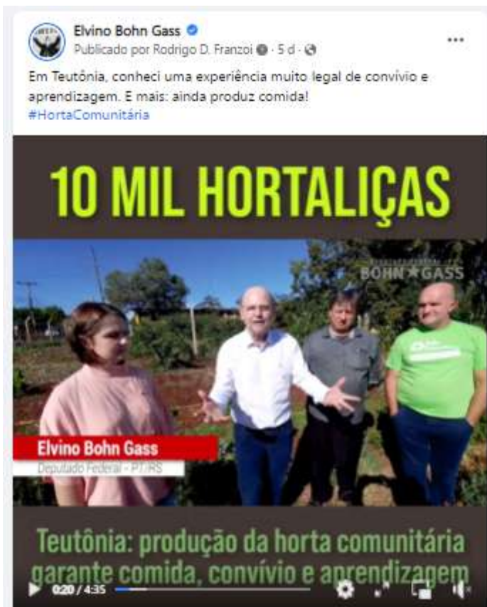
Vídeo produzido e publicado na página facebook.com/bohngass13