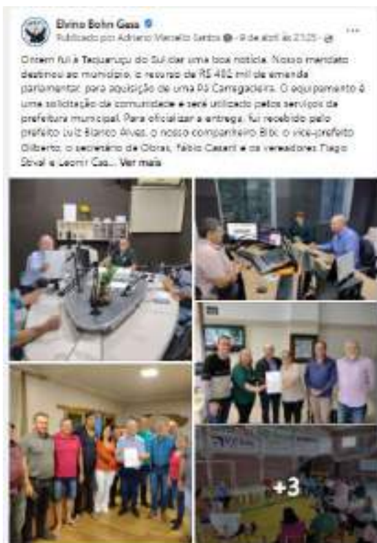
Texto e cobertura fotográfica publicadas na página facebook.com/bohngass13