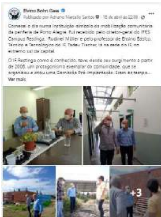
Texto e cobertura fotográfica publicadas na página facebook.com/bohngass13