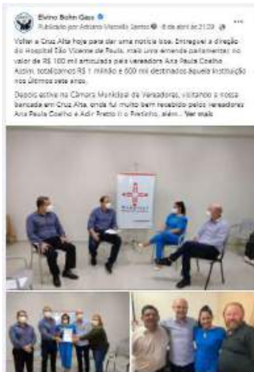
Texto e cobertura fotográfica publicadas na página facebook.com/bohngass13