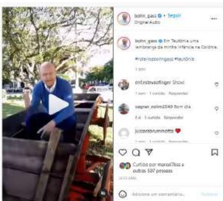
Vídeo produzido e publicado em instagram.com/bohn_gass/reels