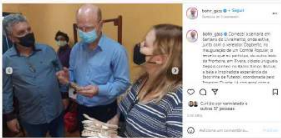
Texto e cobertura fotográfica publicada em instagram.com/bohn_gass/