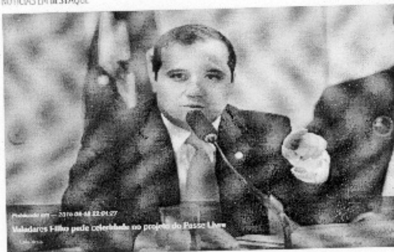
Publicado em: 23/06/2014 12:01:27 Medeiros Filho pede celebração ao projeto do Passo Livre Por: Redação