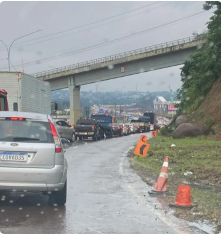
Anda está liberado o tráfego na BR-386 entre Estrela e Lajeado em ambos os sentidos, mas o fluxo aumentou muito nas duas últimas horas.