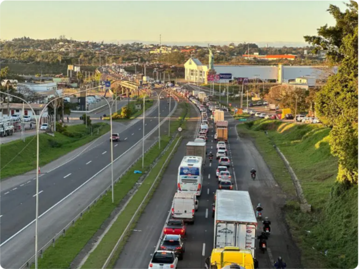
Lentidão deve ser toda a semana, sem previsão ainda de conclusão