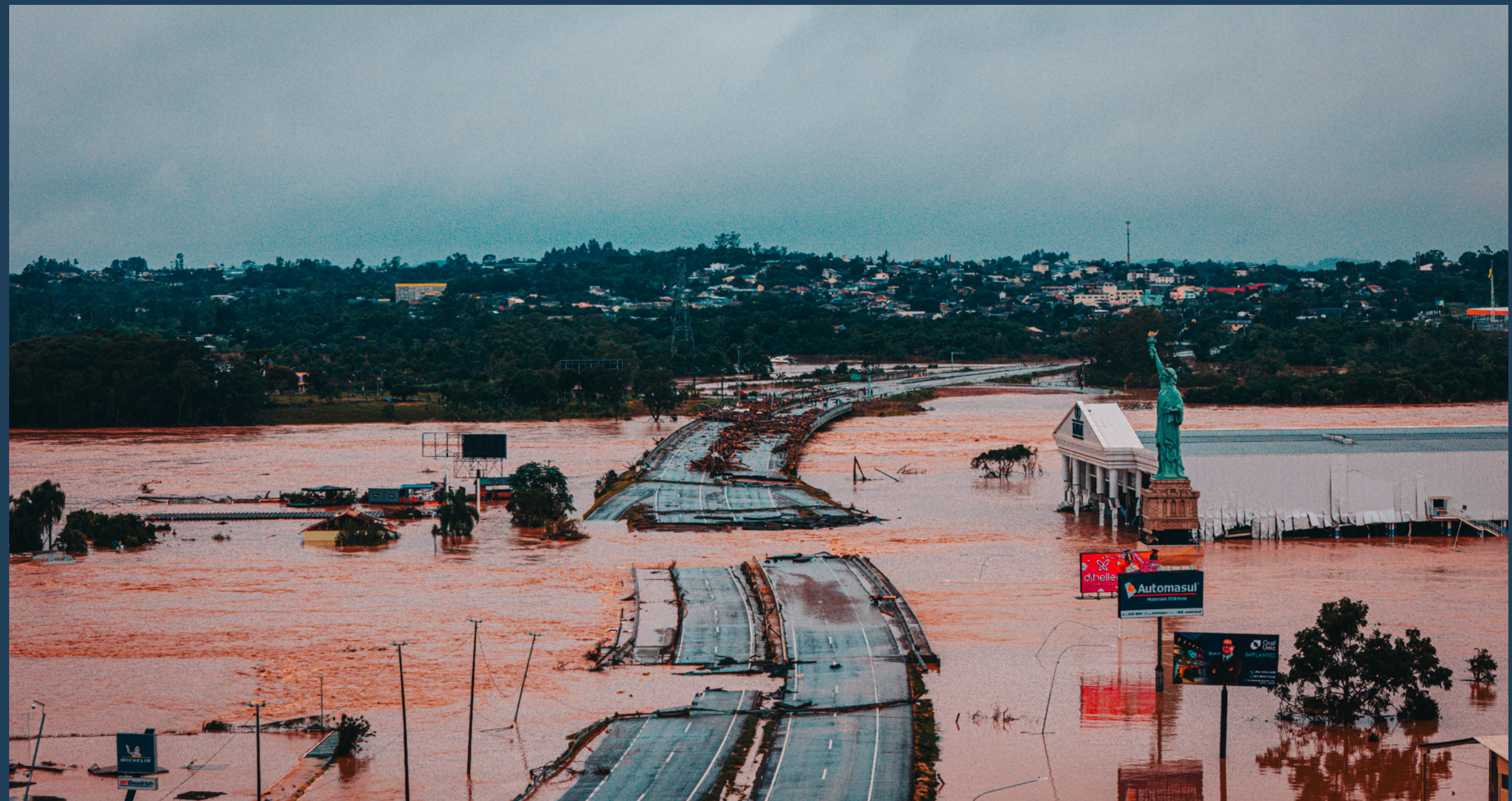
Situação da Ponto do Rio Taquari - 04 de Maio