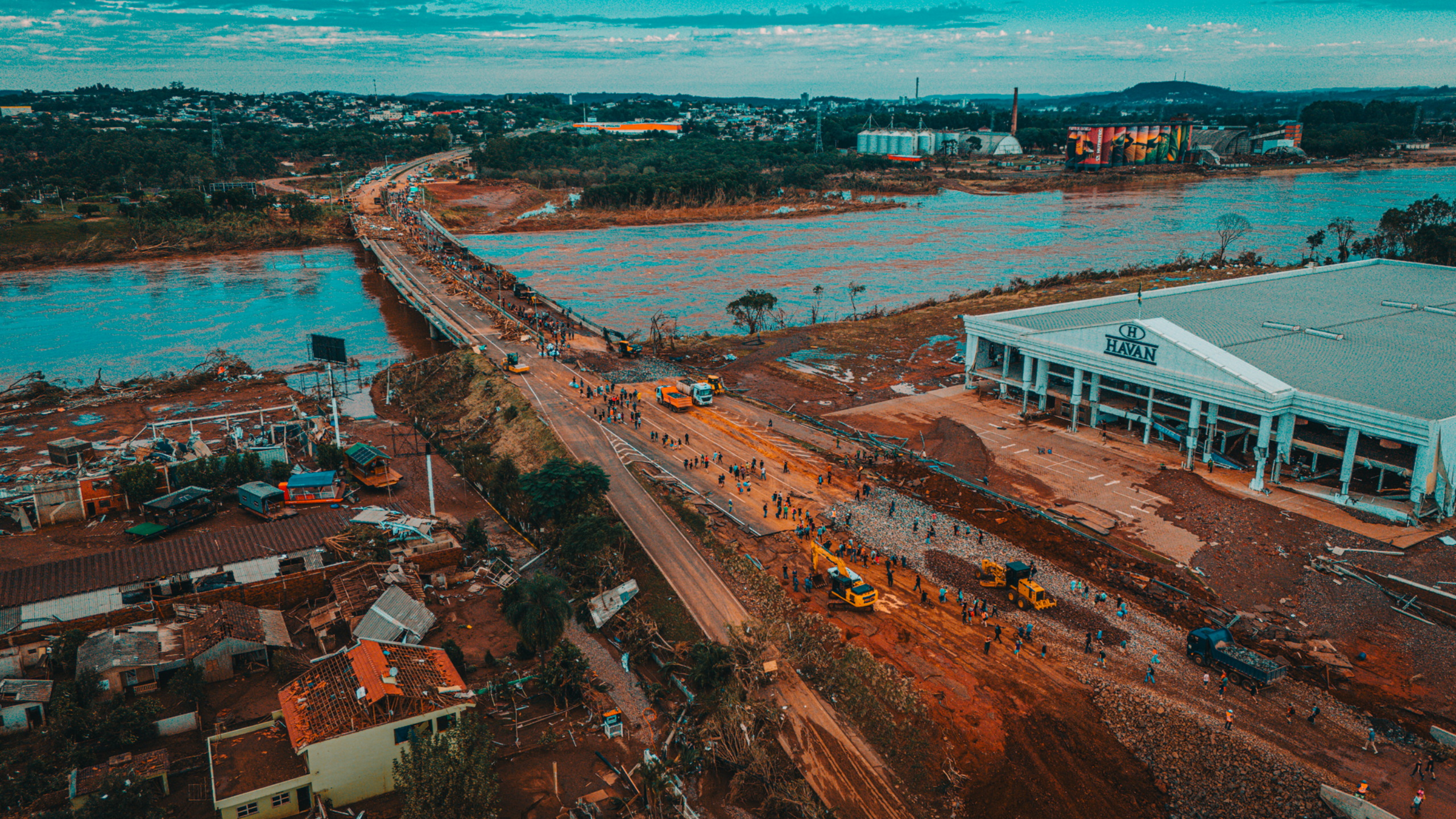
05 de Maio - Primeiros pedestres cruzam a Ponte