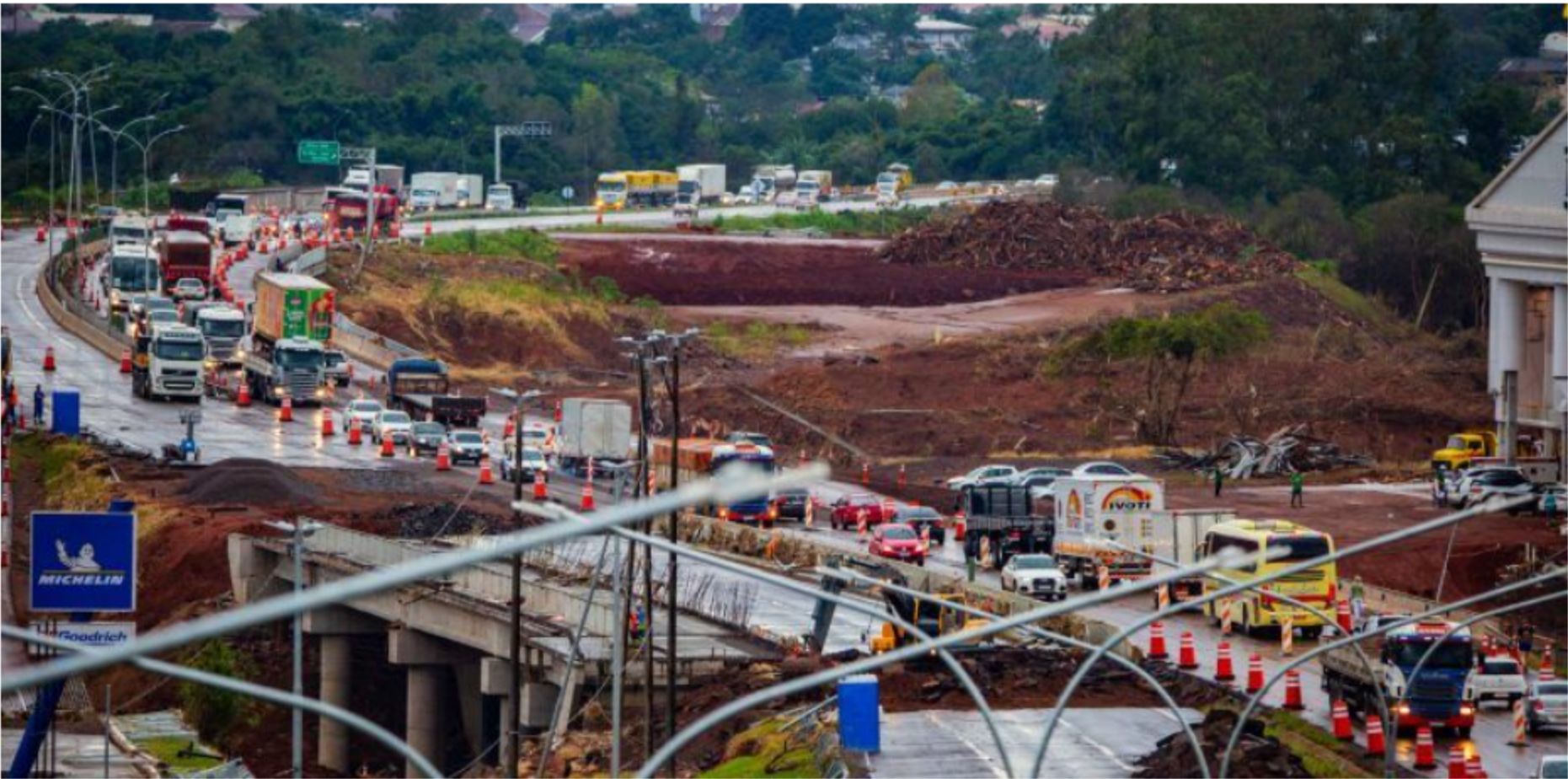
Na sexta-feira, motoristas relataram até cinco horas de espera para cruzar rodovia

Por Redação - sábado, 11 de Maio de 2024 às 07:27 Atualizado sábado, 11 de Maio de 2024 às 07:28