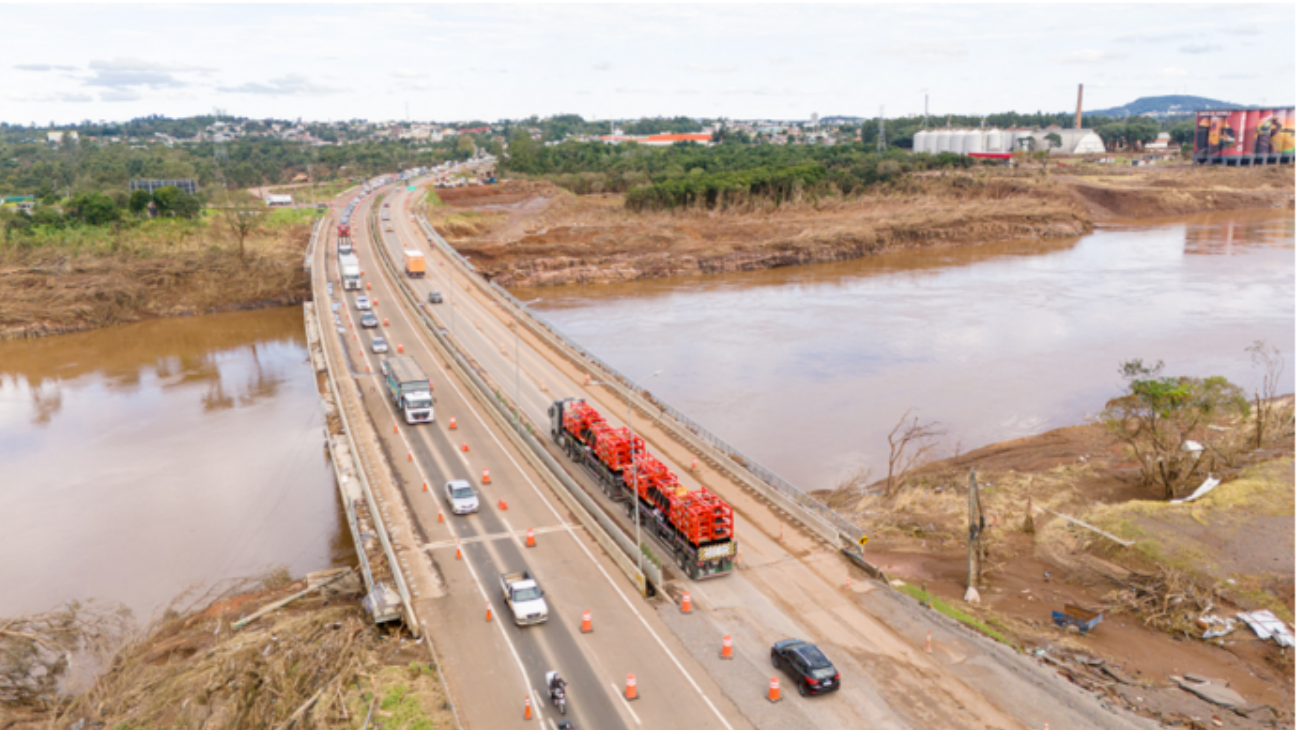
Bloqueio ocorre na ponte sobre o rio Taquari, na BR-386, em Lajeado.

A CCR ViaSul anunciou uma restrição de tráfego na BR-386, em Lajeado . A medida começa a valer a partir da tarde desta quarta-feira (11). A ação visa reparos na ponte sobre o rio Taquari, atingida pela enchente de maio de 2024 .