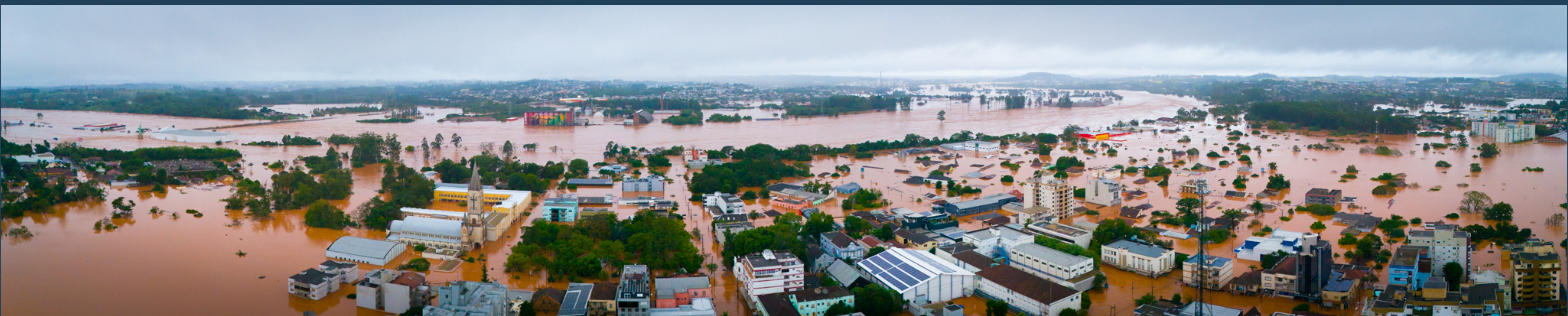
Vista do Rio Taquari